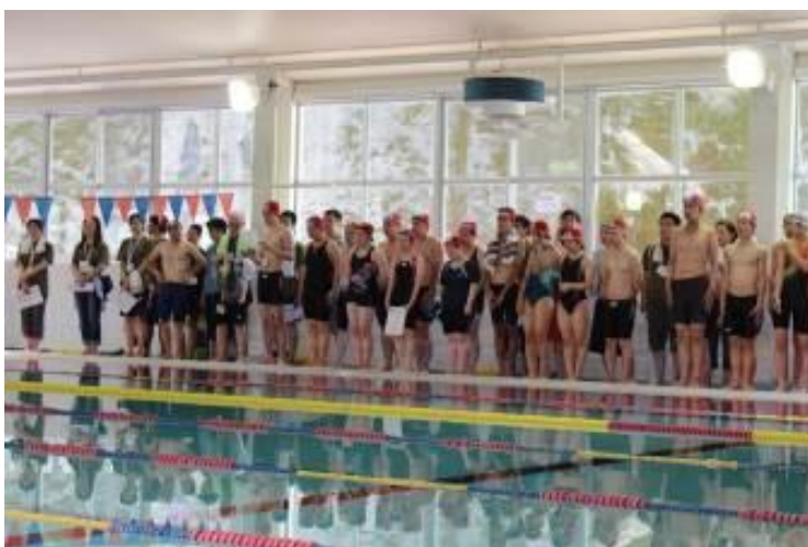
プールサイドはアスリートやパートナーでびっしり

アスリートのみなさん、この日を楽しみにしていたんでしょうね…そんな一生懸命泳ぐ姿に、水泳連盟の役員のみなさんから「キック！キック！」「あと少しだぞ！！」など、熱い励ましの声がかかり、会場内は微笑ましく、温かい雰囲気でした。もちろん、泳ぎ終わったあとは、素敵な笑顔がたくさん見られましたよ！