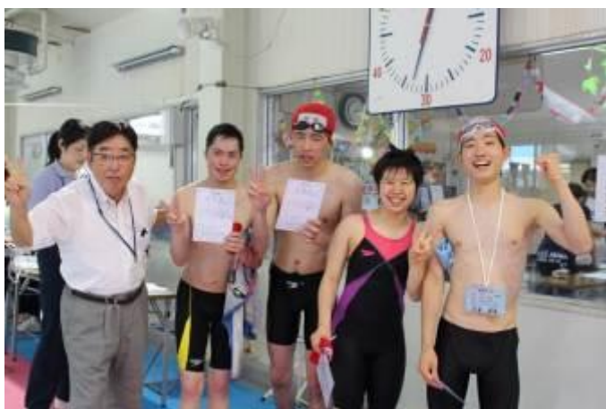
表彰役員さんと一緒に「ハイ！チーズ！！」

準備の段階からお手伝いをしてくださった役員さん、早朝から終了後まで、様々な役割を担ってくださったみなさん、ありがとうございました。